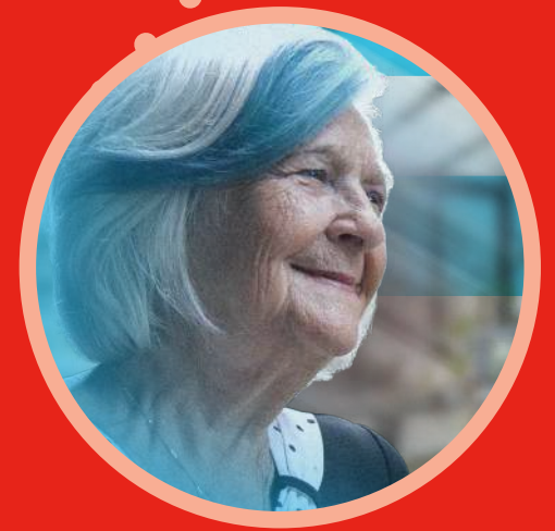
BREAKING SOCIAL ISOLATION