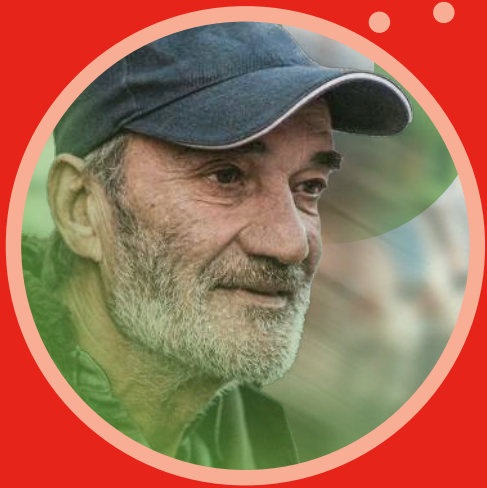
PROVIDING THE BASICS