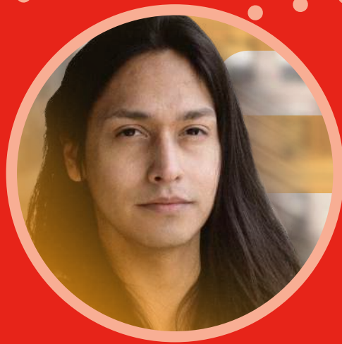
SOUTENIR LA RÉUSSITE DES JEUNES