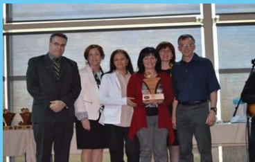
Prix Comité Étoile Comité du tournoi de golf Fairmont le Château Montebello