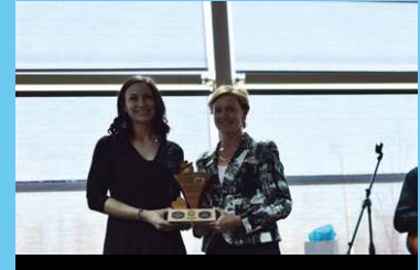
Prix CCMTGC Environnement Canada Agence Canadienne d'évaluation environnementale Parcs Canada