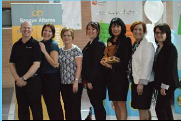
Prix Industries Lauzon – Planchers de bois exclusifs inc.