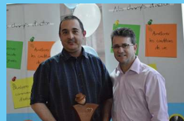
Prix FTQ Erco Mondial – UNIFOR 169