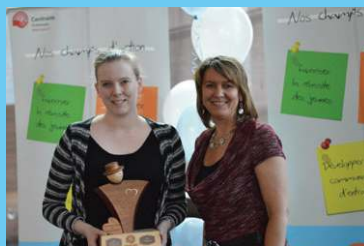
Prix Construction et ingénierie Matériaux de construction DL