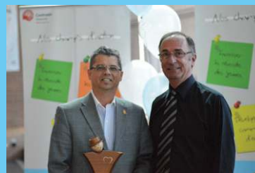
Prix Éducation Université du Québec en Outaouais