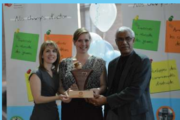
Prix Affaires municipales Municipalité de Cantley