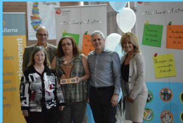
Prix Santé et services sociaux CSSS Gatineau