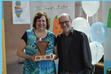
Prix Syndicat du soutien scolaire - Service des ressources humaines - Commission scolaire des Draveurs