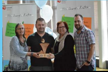
Prix Organismes communautaires Dîner communautaire du Pontiac