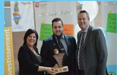
Prix Services financiers professionnels et immobiliers TD Canada Trust