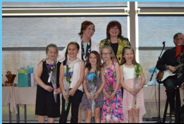
Prix Daniel Coutu Fondation El mik Kid-Kat