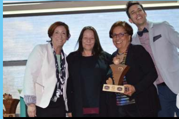
Prix MRC Papineau AFSPN