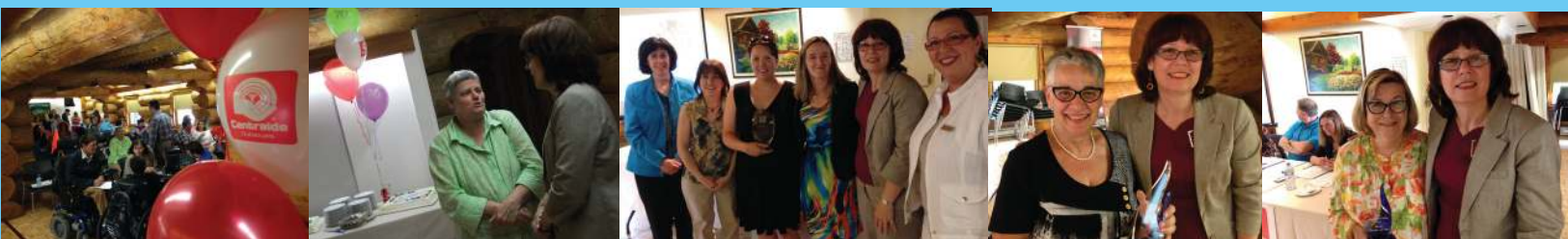
Prix Coup de cœur Maison de la famille de Quyon

Pendant l'année marquant nos 70 ans, le logo de Centraide Outaouais a été modifié afin d'y retrouver la mention 70 ans. De plus, cet anniversaire a permis de réintroduire deux prix reconnaissance: le Prix Coup de cœur remis à un organisme et celui de la présidence, que nous avons rebaptisé Prix Marie Fauvelle, remis à un bénévole de Centraide Outaouais. Ces prix sont une manière pour nous de mettre en valeur le travail exceptionnel d'organismes et d'individus qui font une différence jour après jour, dans le quotidien des gens de notre belle région.