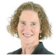
CARYL GREEN Mairesse de la municipalité de Chelsea et préfète MRC Des- Collines-de-l'Outaouais